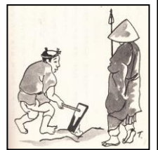
錫杖井戸のはなし

「このおぼろさんが とよかわに みえたとき (きたとき)のことです。たいへん うちが かわいたので、ちかくの うちの ひとに「わた しは たび(りよこう)を して いますが、く ちが かわいたので、みずを いっぱい くださ い。」と おねがい しました。すると、いえ の ひとが 「この あたり(へん)には、みず が ありません。すこし まって ください。 きれいな みずを くんできます。」と いい ました。しばらく まっているとおおいそぎ できれいな みずを くんでもって きて、 おぼろさんに あげました。 「こんな しんせつに して いただいて、お いしい みずを のんだのは、はじめて です。 ありがとうございます。」 おいしそうに みずを のんだ おぼろさん は、 ていねいに おれいを いいました。 「とよかわの ひとびとは、ずいぶん(とても) みずに ごぶじゆう(こまっつ)して いるよう ですね。おれいに わたしが、いくら(どんな に)つかっても みずが なくなるならいどを さがして あげましょう。」と いって、 たちあ がりました。 (つづきます)