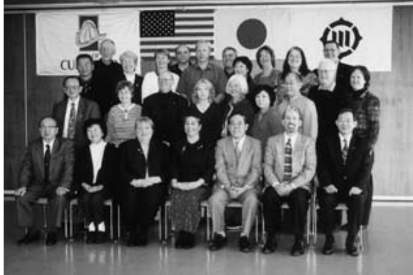
市役所会議室で記念撮影