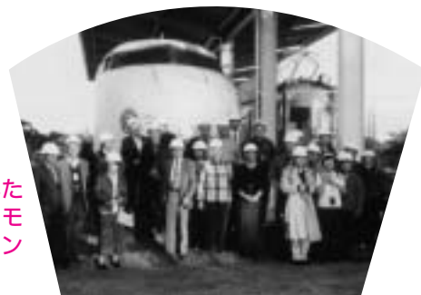
日本車輛製造を訪問し初代新幹線の前にて