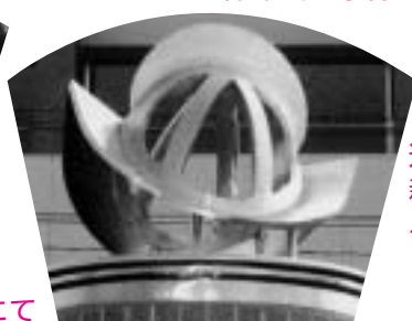
送られた 新しいモ ニュメン ト