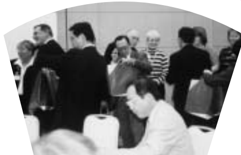
はて、おみやげの中身は？ 歓迎会の会場にて