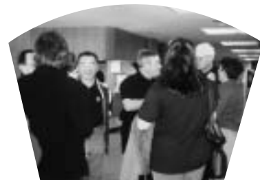
市役所ロビーで談笑中の使節団員