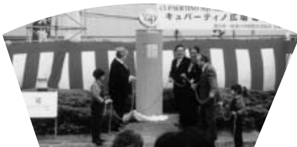
体育館前を「キューパーティノ広場」と命名し、キュパティーノ市から送られたモニュメントの除幕式を挙行