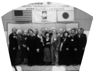
歓迎会の壇上の一行